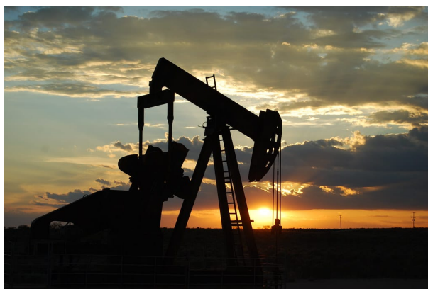
Pozo de petróleo en el campo West Seminole, Texas.

En 2019, Velocys anunció planes para un proyecto de conversión de biomasa en combustible en Natchez, Mississippi. La planta de Bayou Fuels gasificará biomasa leñosa, capturará CO 2 y producirá combustible sintético para aviones. Además, Velocys ha firmado un acuerdo con Oxy Low Carbon Ventures para transportar e inyectar el CO 2 capturado en formaciones geológicas. Velocys aún no ha confirmado si ha logrado asegurar el financiamiento para la planta, y no hay indicios de que la construcción comience pronto.