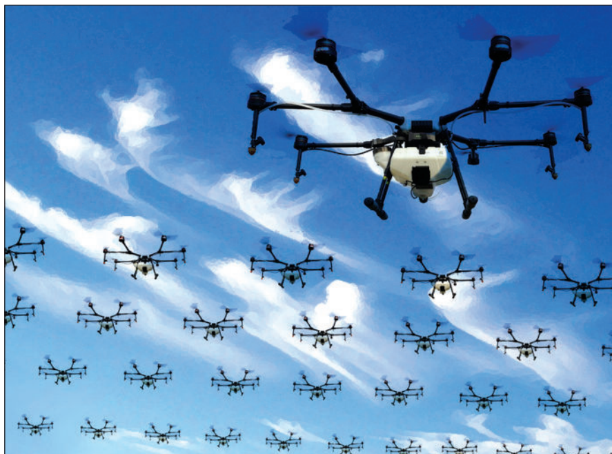
¿Drones rociando partículas para enfriar el planeta?

Los promotores de la propuesta teórica de geoingeniería solar conocida como adelgazamiento de nubes cirrus (CCT, por sus siglas en inglés) proponen inyectar núcleos de hielo —como trióxido de bismuto o partículas de aerosol, como ácido sulfúrico o nítrico— en las regiones donde se forman las nubes cirrus. Esto, según infieren, produciría nubes cirrus con cristales de hielo más grandes y que duran menos, a la vez que reduciría su profundidad óptica, lo que