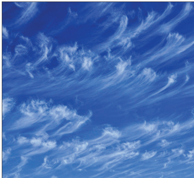
Nubes cirrus.

// Preocupa el hecho de que se realice adelgazamiento de nubes cirrus a nivel global para crear respuestas climáticas en determinadas zonas. Este tipo de despliegue localizado podría causar impactos negativos en regiones y comunidades que no son el objetivo, precipitando serios conflictos. El que un país evite una ola de calor mediante estas técnicas podría provocar inundaciones en otro. //